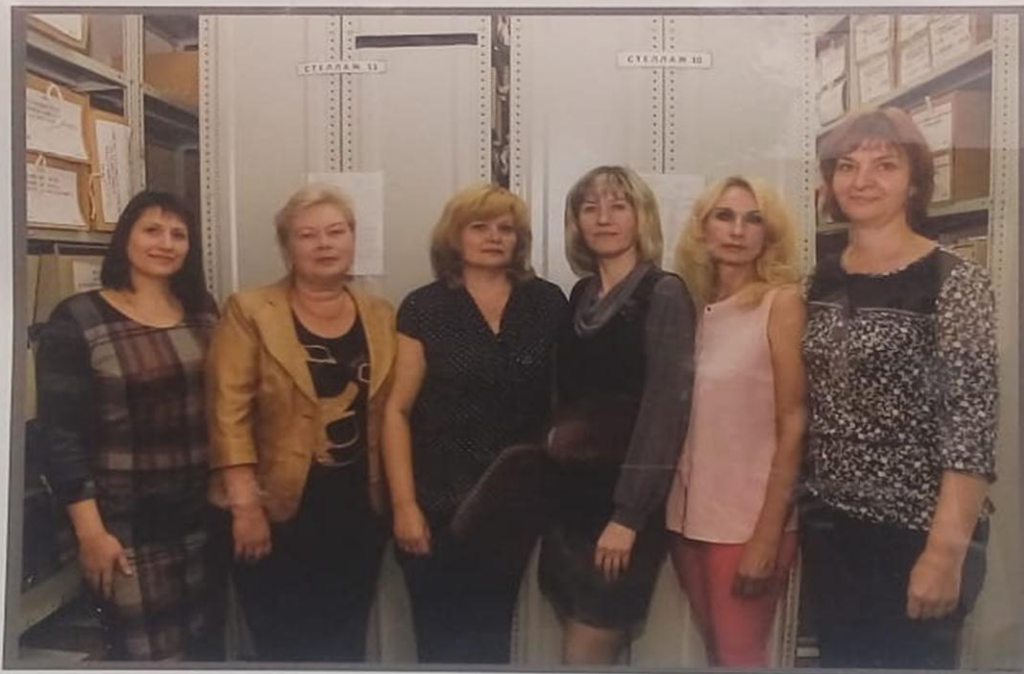
Сотрудники архивного отдела Администрации городского округа Истра

Два года подряд, в 2017 и 2018 годах коллектив архивного отдела награжден Благодарностями Губернатора Московской области за добросовестный труд и большой вклад в развитие архивного дела. В следствии чего, коллектив удостоен чести размещения на Стенде Почёта городского округа Истра